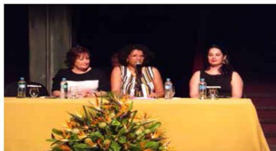
Presidente do CFB, Presidente e vice do CRB-8

Por ocasião das comemorações do Dia do Bibliotecário em 2013, o Conselho Federal de Biblioteconomia contratou agência especializada em mídia radiofônica. O rádio continua sendo uma estratégia ágil e eficaz, capaz de levar temas importantes de valorização da profissão do bibliotecário para um grande número de pessoas simultaneamente. A empresa contratada divulgou, em aproximadamente quatro mil emissoras no Brasil, entrevistas com membros da diretoria, das comissões do CFB, com bibliotecários, parlamentares e outras autoridades, destacando a importância desse profissional para a sociedade.