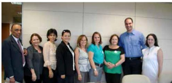
Diretoria do CFB e coordenação-geral Ead/CAPEES