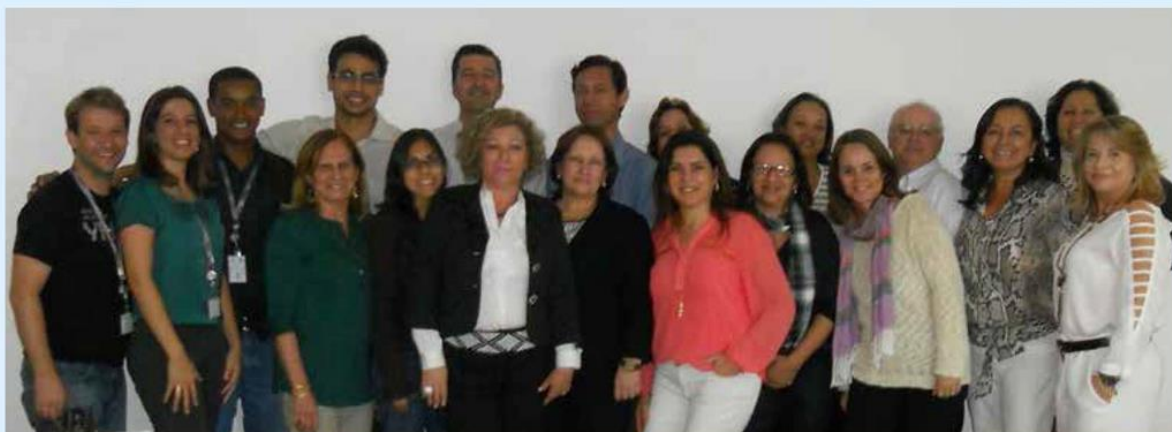
CFB, Comissão de Especialistas em Bibliotecas Universitárias e INEP.