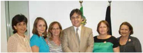
Diretoria do CFB e o Senador Cássio Cunha Lima, relator do PLC 28/2012.