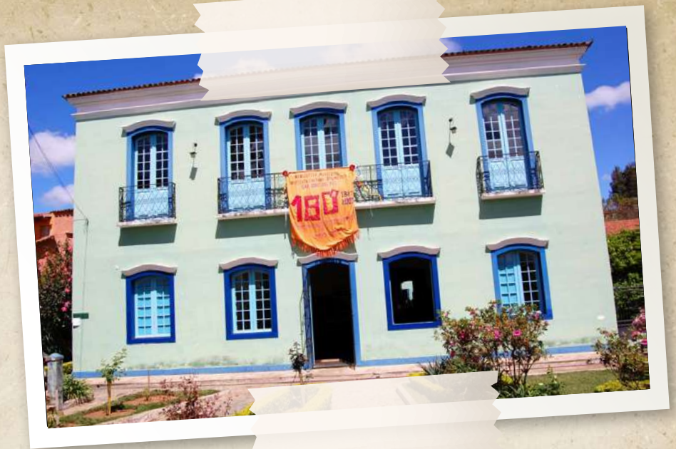
Biblioteca Pública Municipal Baptista Caetano d'Almeida

nascimento se deu junto ao Convento Nossa Senhora do Carmo, na Praça João Lisboa, mas depois se instalou numa sala da antiga Assembleia Legislativa, na Rua do Egito. Mais tarde, se mudou para uma sala do Liceu Maranhense, na Rua Urbano Santos. Posteriormente, foi feita a mudança para o prédio que hoje abriga a Academia Maranhense de Letras, na Rua da Paz. Finalmente, em 1951, foi realocada no atual prédio, que fica localizado na Praça Deodoro. Em 1958 ela recebeu o nome de Benedito Leite, em homenagem ao importante jornalista (Maranhão, 2025).