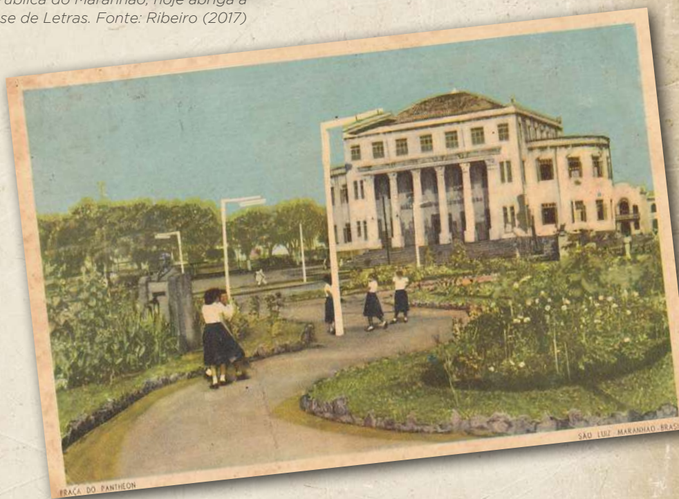
Cartão -Postal antigo mostra a Biblioteca Pública do Maranhão, em prédio inaugurado em 12 de setembro de 1951.

Atualmente, a biblioteca possui 140 mil volumes, sendo 9.670 obras raras, além de mais de 2 mil títulos em Braille e ampliados. Através do Projeto Acessibilidade em Bibliotecas Públicas, desenvolvido pelo Ministério da Cultura/Sistema Nacional de