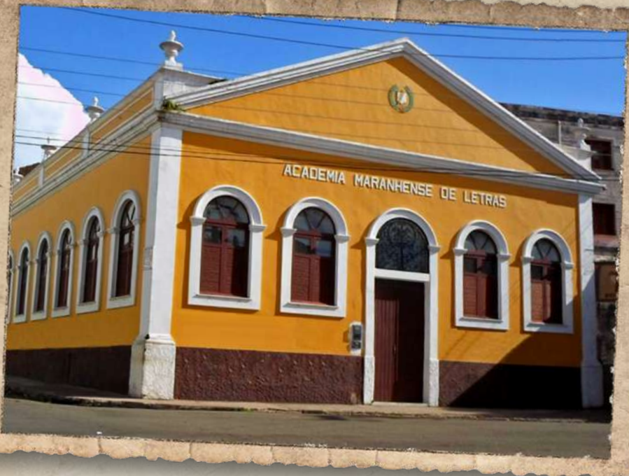
Antigo Prédio da Biblioteca Pública do Maranhão, hoje abriga à Academia Maranhense de Letras.

Bibliotecas Públicas e executado pela Organização da Sociedade Civil de Interesse Público - OSCIP “MAIS Diferenças”, a Benedito Leite, uma das 10 contempladas com o Projeto no Brasil, transformou-se em referência em acessibilidade arquitetônica, atitudinal e bibliográfica. Possui, também, a maior coleção de jornais maranhenses (558 títulos), uma fonte de pesquisa de valor inestimável. Esse riquíssimo acervo atende uma média de 10 mil pessoas por mês, presencialmente, mais 40 mil consultas online, totalizando 50 mil atendimentos mensais. Além disso, se tornou um ponto turístico são-luisense, pela beleza arquitetônica de seu prédio (Maranhão, 2023).