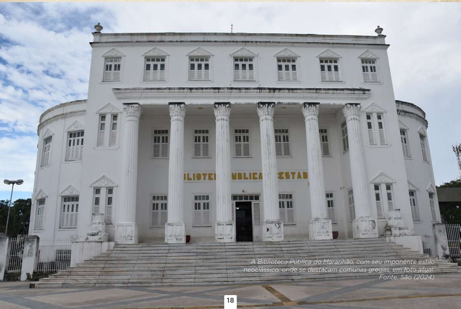
A Biblioteca Pública do Maranhão, com seu imponente estilo neoclássico, onde se destacam comunas gregas, em foto atual.

Pensando na difícil situação das bibliotecas públicas no