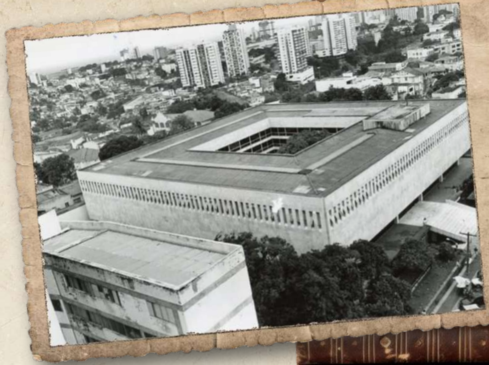
Biblioteca Pública da Bahia, em seu prédio atual

oligarquias provincianas durante os primeiros anos da República Velha fizeram com que o Marechal Hermes da Fonseca, então Presidente da República, desse a ordem de bombardear a cidade por quatro horas e com isso a biblioteca perdeu 99% do seu acervo, ficando com apenas 300 livros. Com o passar dos anos a biblioteca se recuperou, cresceu em acervo e passou por várias sedes, até ser reinaugurada, em 1970, no prédio atual dos Barris (Pontes, 2006; Milanesi, 1989, p. 71; Oliveira, 1994).