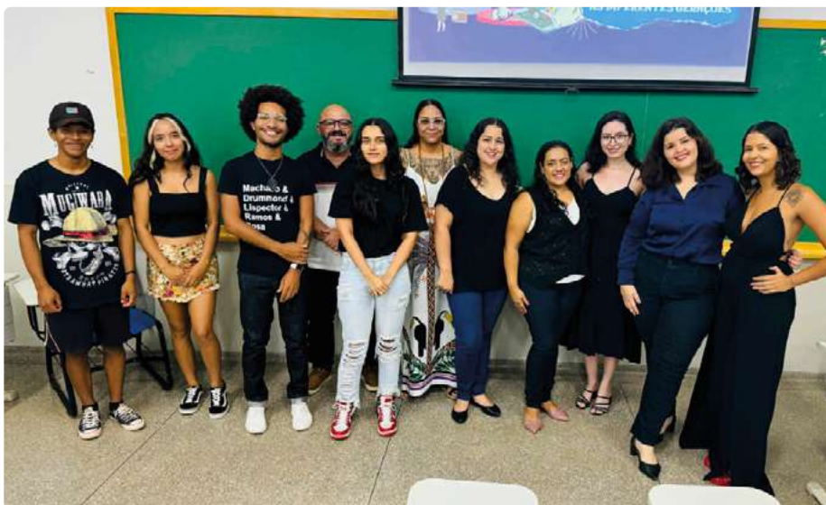
Bibliotecários e estudantes presentes no evento.

No último dia 15 de março, o auditório da Faculdade de Direito e Relações Internacionais (FADIR) da Universidade Federal da Grande Dourados (UFGRD) recebeu um evento que trouxe à tona discussões sobre a evolução da Biblioteconomia e o impacto das gerações Z e Alfa no contexto das bibliotecas. Sob o tema “Biblioteconomia em evolução: gerações e suas evoluções”, o evento foi realizado em parceria com a UFGRD e reuniu profissionais e estudantes interessados no tema.