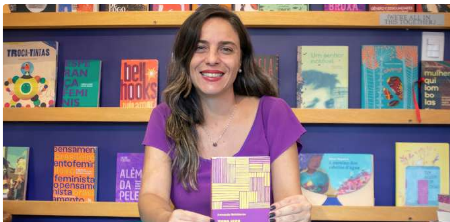
Deputada Federal Fernanda Melchionna

Vivemos num país desigual e isso se reflete também na desigualdade de acesso à informação. Segundo o último Censo, cerca de 11,4 milhões de brasileiros eram analfabetos, o que representa um total de 7% do grupo entrevistado. Quando olhamos pra raça, a desigualdade fica ainda mais evidente: as taxas de analfabetismo de pretos e pardos são mais que o dobro das dos brancos, e a