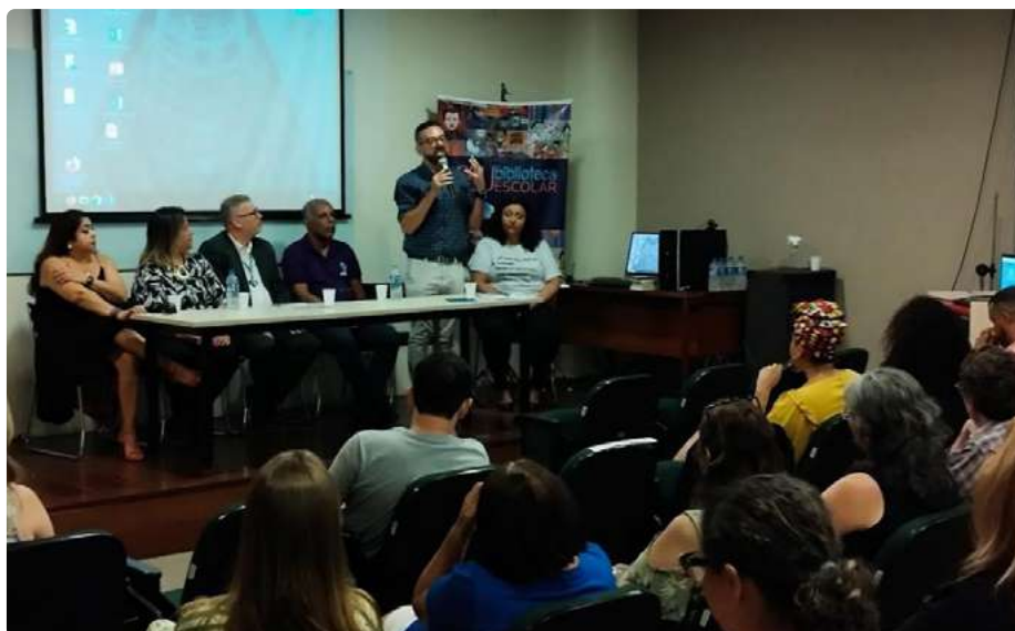
Abertura do Evento

À tarde, no auditório Rui Cruse, do Instituto de Educação, Ciência e Tecnologia do Rio Grande do Sul (IFRS) - Campus Porto Alegre, ocorreram - a mesa de abertura do evento e duas importantes mesas de debates - com a participação de autoridades, profissionais da área e convidados. Na solenidade de abertura estiveram presentes: o Diretor Geral do IFRS Câmpus Porto