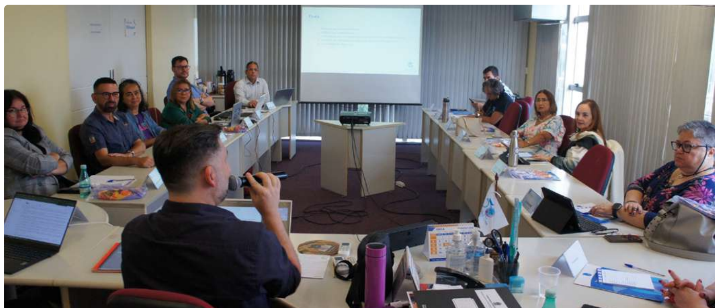
Mesa completa com os presidentes.

O Fórum de Presidentes é composto pelos presidentes do CFB e dos CRB, ou seus representantes legais, e é coordenado pelo presidente do CFB. As reuniões, de caráter não deliberativo, são privadas, e suas decisões são submetidas à apreciação do Plenário do CFB. Na abertura de cada sessão, o presidente do Fórum propõe a metodologia de condução dos trabalhos. As reuniões são registradas em ata própria, lida e aprovada ao final de cada encontro, com um dos membros atuando como secretário. O Fórum ocorre ordinariamente uma vez por ano, com quórum mínimo formado pela maioria simples dos seus membros, para tratar de assuntos diretamente relacionados à gestão dos Conselhos.