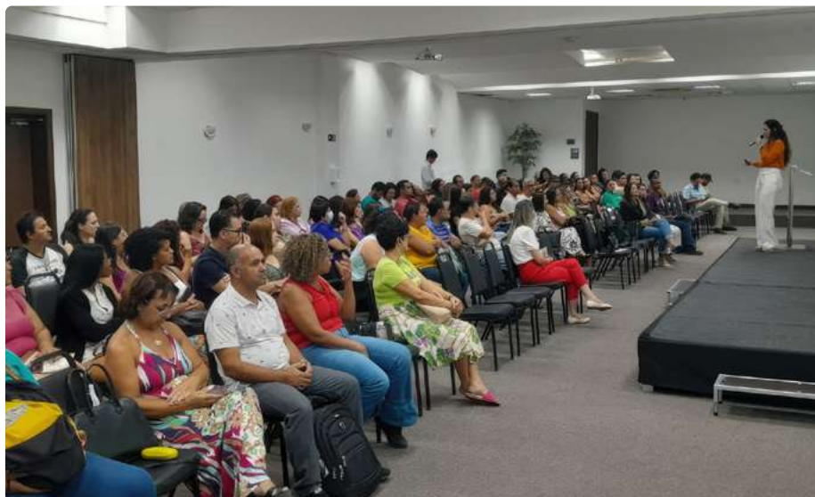
Participantes do Workshop

Com a temática “Tendências e inovações tecnológicas