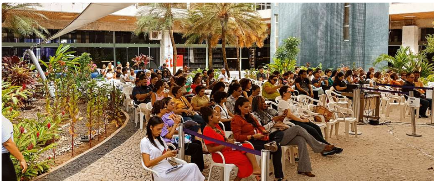
Participantes do workshop

O Conselho Regional de Biblioteconomia da 5ª Região realizou dois eventos para celebrar o Dia da Pessoa Bibliotecária. O primeiro ocorreu no dia 12/03 em parceria com CFB, Fundação Pedro Calmon, Instituto de Ciência da Informação (ICI)/ Universidade Federal da Bahia (UFBA) e o Centro Acadêmico. O evento aconteceu em Salvador (BA) na Biblioteca Pública do Estado,