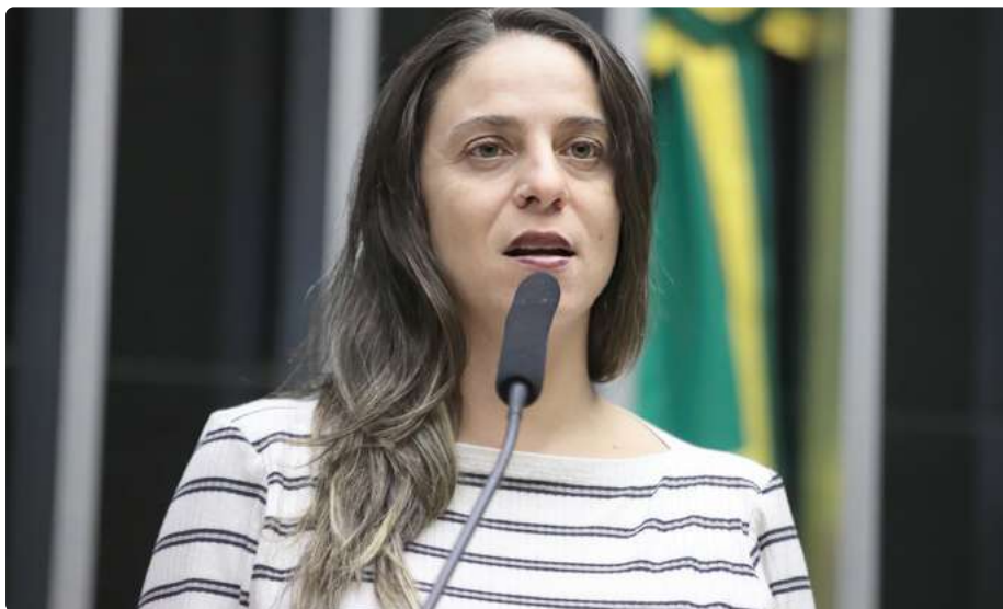
Deputada Federal Fernanda Melchionna

multifuncionais, úteis para outros aspectos da vida. Por exemplo, podemos agregar público ao transformarmos uma biblioteca em mural de empregos ou em centros de formação e alfabetização.