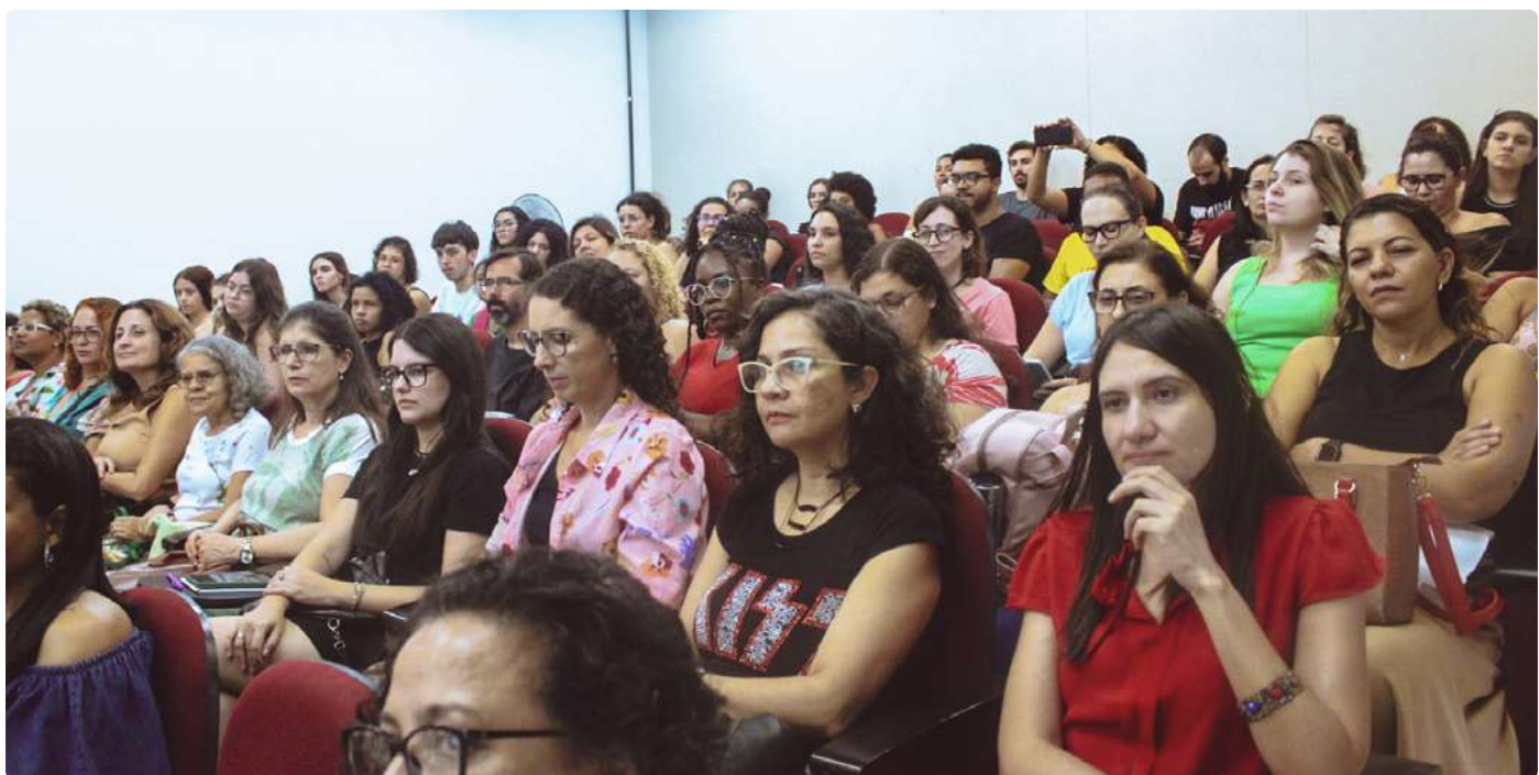
Bibliotecários e estudantes presentes no evento.

Informações sobre os certificados de Belo Horizonte devem ser obtidas pelo site https://semanadobibliotecario.eci.ufmg.br , ou pelo e-mail bib@eci.ufmg.br . Para quem acompanhou as palestras de Vitória, deve entrar em contato pelo e-mail: secretaria@crb6.org.br .