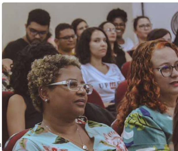
Bibliotecários e estudantes presentes no evento.

“Eu gosto de pensar que a inovação está dentro da gente e que não precisamos criar algo novo, extremamente tecnológico. A gente pode inovar com pouco