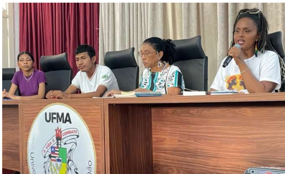
Abertura do Evento

Com a temática “Letramento Racial e Bibliotecári@ Antirracista”, o evento teve como objetivo ampliar o debate e a conscientização política da classe bibliotecária, discentes do curso de Biblioteconomia da UFMA e profissionais de áreas afins, no combate ao racismo estrutural e a importância de ressignificar o papel das bibliotecas na construção de práticas de letramento racial.