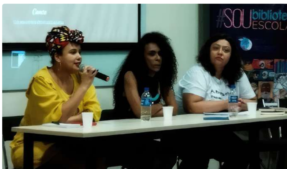
Live de dia da Mulher

A segunda mesa, com duração de duas horas, intitulada “Leitura e Literatura Racial”,