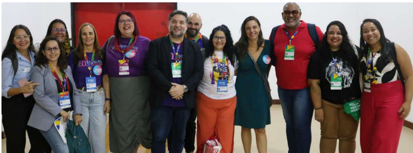
Bibliotecários na 4ª Conferência Nacional de Cultura.

A participação do Sistema CFB/CRB na 4ª Conferência Nacional de Cultura foi fundamental para reafirmar a importância das bibliotecas e da biblioteconomia no cenário cultural brasileiro. O engajamento contínuo do Sistema CFB/CRB em eventos e debates sobre políticas culturais é crucial para garantir que as bibliotecas continuem a ser espaços de inclusão, aprendizado e transformação social.