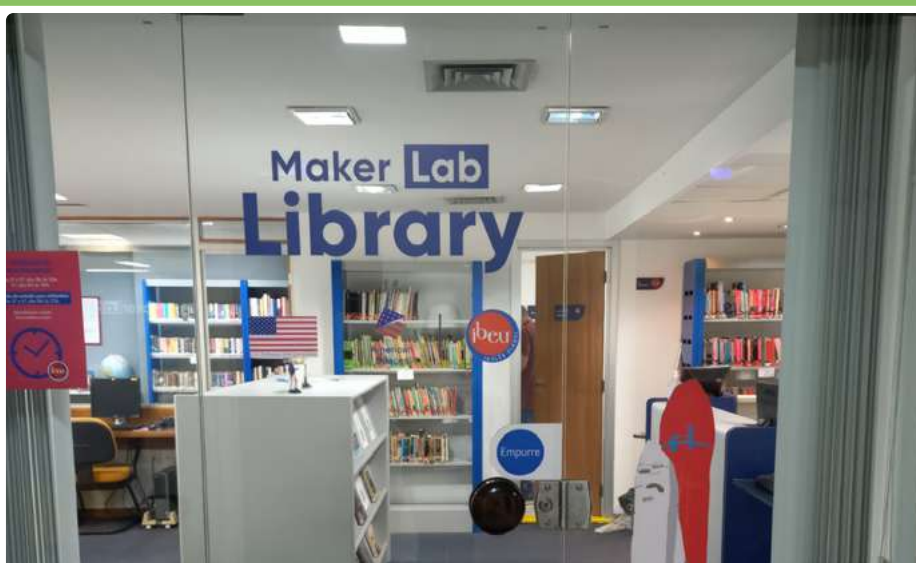
Visita a biblioteca IBEU