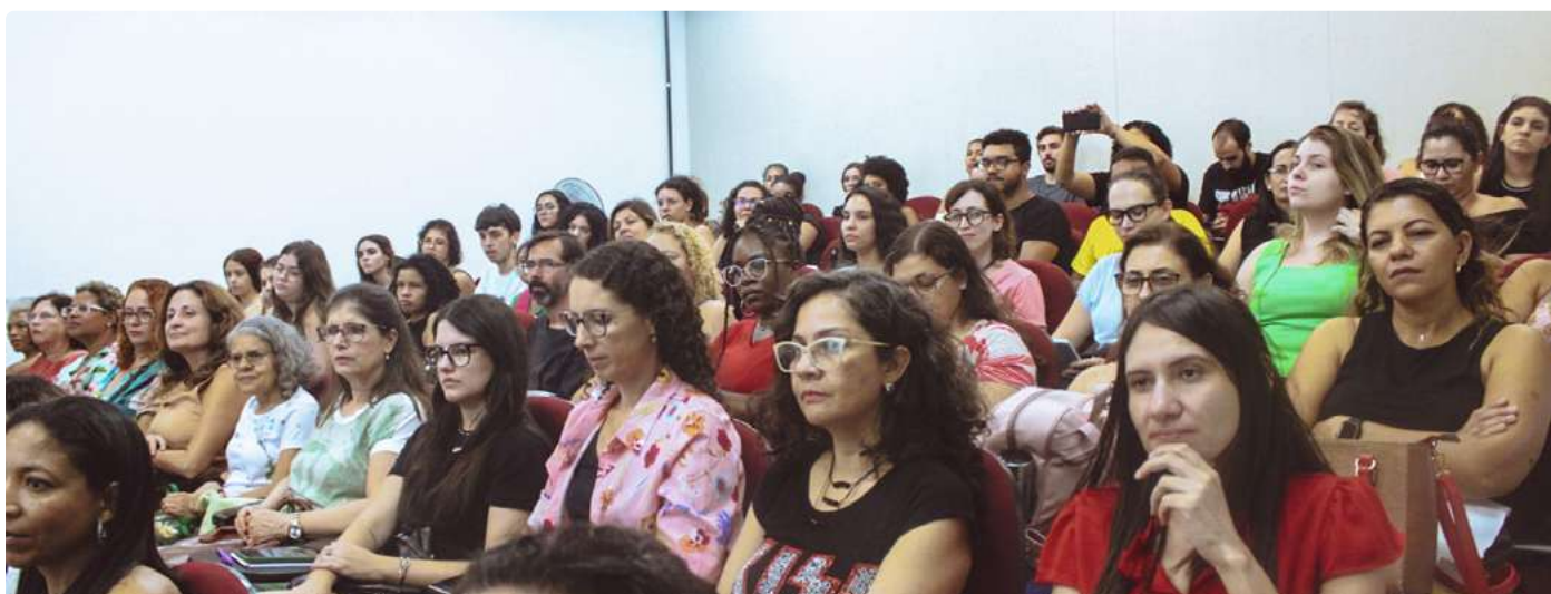
Bibliotecários e estudantes presentes no evento.

Confira abaixo, como foi o evento em cada cidade: