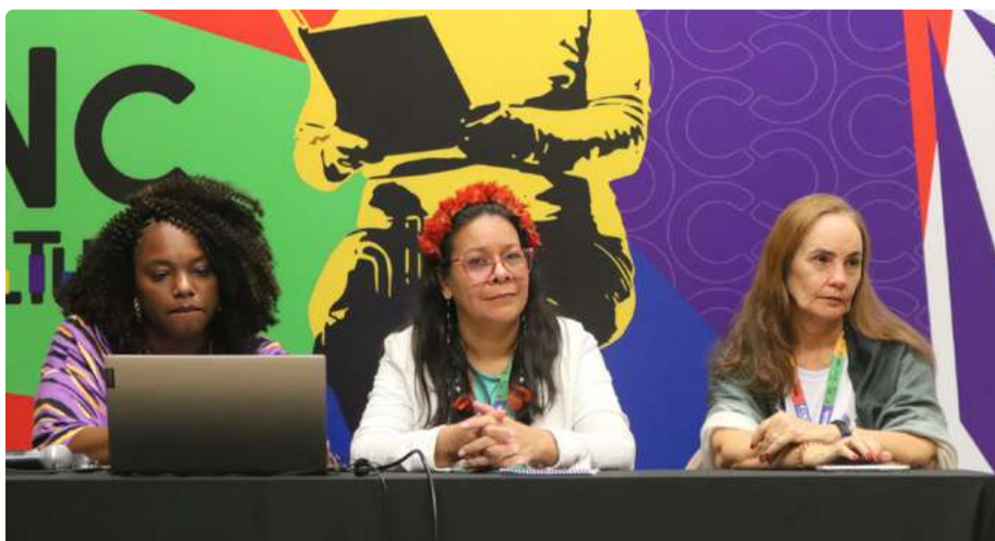
Abertura do Evento

A delegação do CFB/CRB também se envolveu em atividades autogestionadas, onde puderam discutir