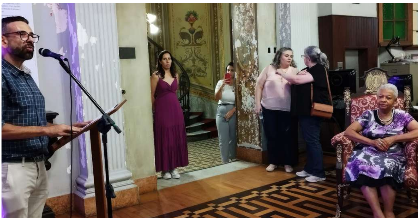
Evento na biblioteca pública do estado do Rio Grande Do Sul (BPE-RS)

anos da história, registramos também sua dedicação e contribuição na 4ª Gestão do CRB-10, como conselheira durante os anos 1976 a 1978. Nesse contexto, a reverenciamos como Conselheira que, durante esse período, guiou e guia até hoje, a jornada de muitas bibliotecárias e bibliotecários com profissionalismo e maestria.