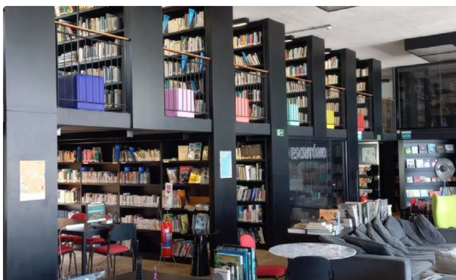
Visita a biblioteca do Instituto Cervantes

Fechando o mês, o podcast Transitando na Biblio, recebeu a Prof a . Dr a . da UFRJ – Campus