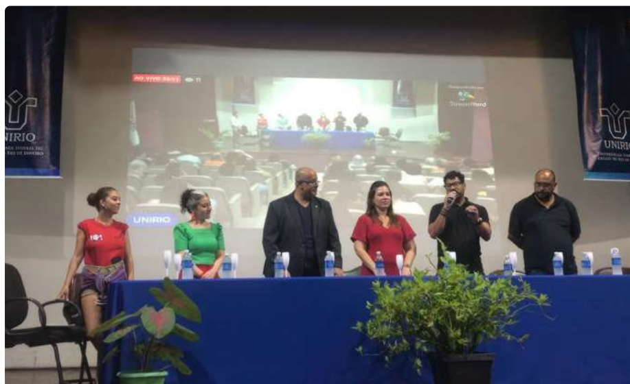
Abertura do Evento

Conselho Regional de Biblioteconomia 7ª Região - Rio de Janeiro