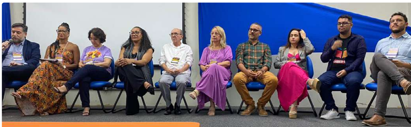
Parte dos Conselheiros e funcionários do CRB5

PPGCI da mesma universidade e do Centro Acadêmico. No estado de Sergipe o evento ocorreu no dia 13/03 iniciando-se às 16h com workshops ligados à temática do Letramento racial. A abertura oficial começou às 19h e seguiu com atividades de lançamentos de livros, homenagens e apresentações culturais, concluindo-se os trabalhos às 21h30. Estima-se a participação de 137 pessoas.