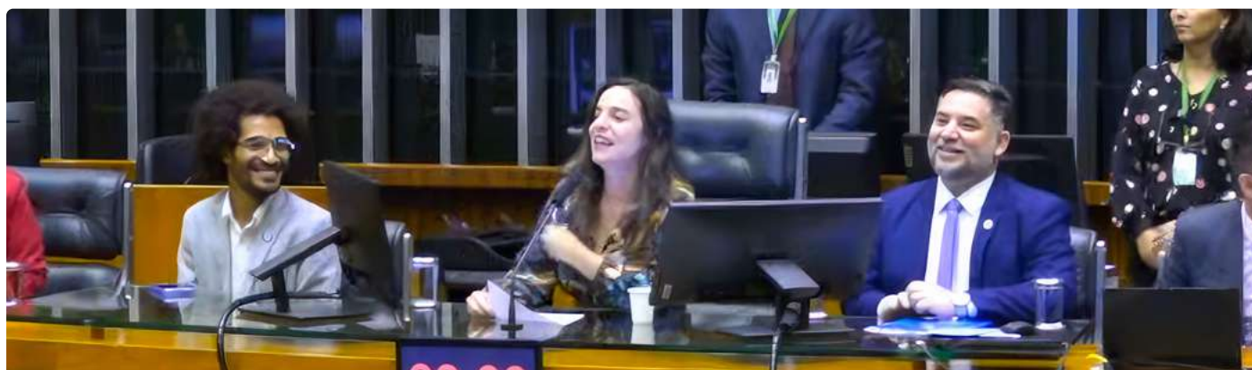
Deputada Federal Fernanda Melchionna no centro

Além de o livro ser fundamental para a construção de cidadania, emancipação cultural e crescimento intelectual, o livro também é capaz de nos devolver a capacidade de sonhar, sonhar com um futuro possível e com dias melhores. Depois de tantas desgraças, que inclusive seguem em curso no RS, é fundamental que os gaúchos sustentem a capacidade de sonhar para ter a força necessária para a reconstrução de seus lares e de suas vidas.