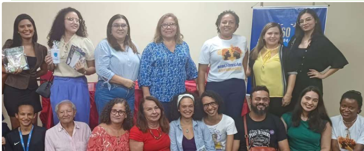
Abertura do Evento

comunidades indígenas e do letramento racial na instituição IFMA para a inclusão de alunos representantes dos povos originários.