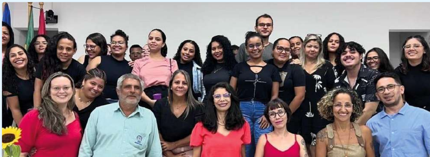
Participantes do evento na UFR. Alunos de biblioteconomia e bibliotecários.

A Universidade Federal de Rondonópolis (UFR) foi palco, no dia 14 de março, de uma palestra que colocou em foco a relevância da mediação da informação na atuação dos profissionais bibliotecários. Com o título “Mediação da informação na atuação bibliotecária: práticas e impactos”, o evento teve como objetivo apresentar o embasamento do conceito de mediação da informação e sua aplicação na prática