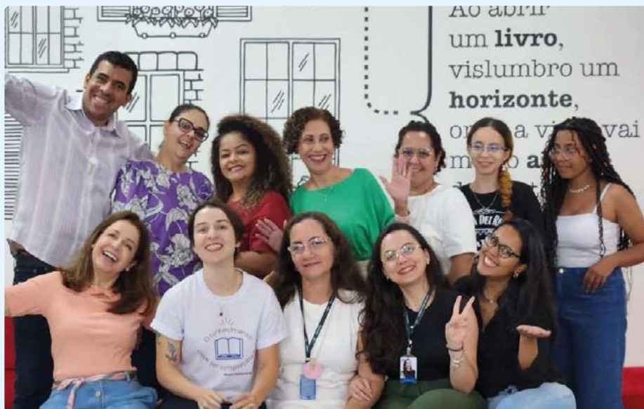
Participantes do workshop

No dia 14 de março, o SESC/GO sediou um evento para profissionais da área de Biblioteconomia: o Workshop sobre Design de Serviços para Bibliotecas. A iniciativa proporcionou uma imersão teórica e prática conduzida pela renomada palestrante Christiane Coelho, bibliotecária da Câmara dos Deputados.