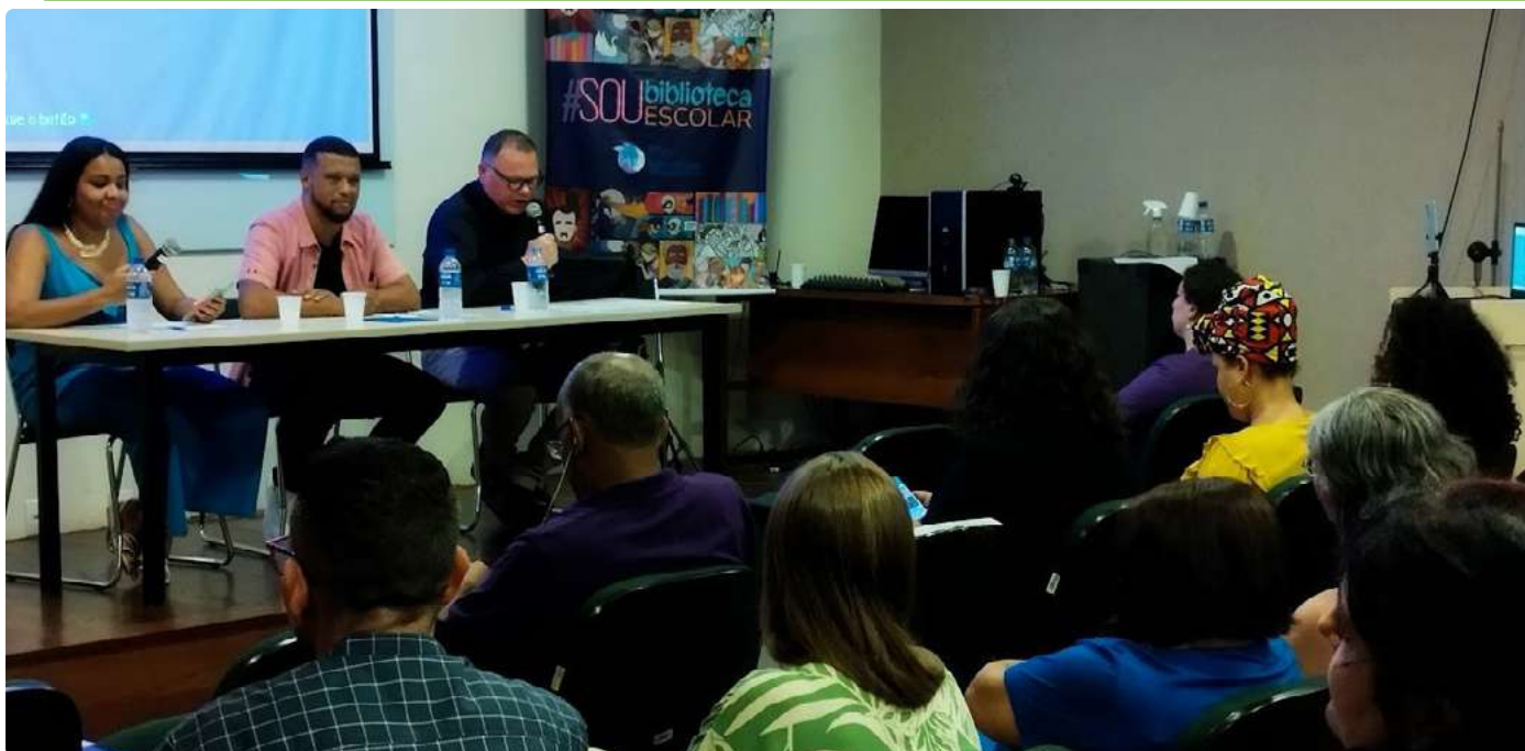
MESA 2: Leitura e Literatura Racial