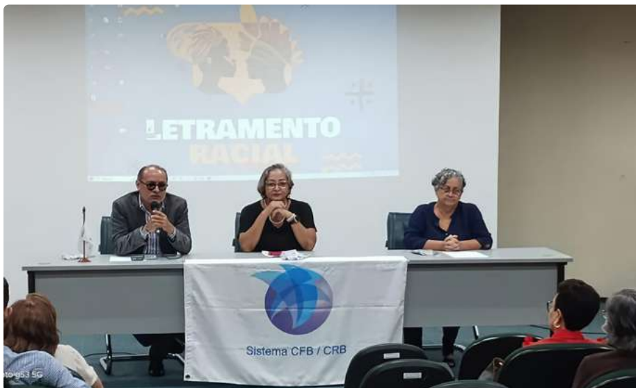
Mesa de abertura

No mês de março, mês em que se comemora o Dia do/a Bibliotecário/a no Brasil, ocorreram algumas programações alusivas a essa data no âmbito do CRB-2. As atividades aconteceram nas cidades de Belém/PA, Macapá/AP e Palmas /TO, todas de modo simultâneo no dia 12 de março. Teve como tema geral “Bibliotecas e Bibliotecários(as) antirracistas: conectando todas as culturas e povos”. A seguir as atividades serão apresentadas respectivamente.