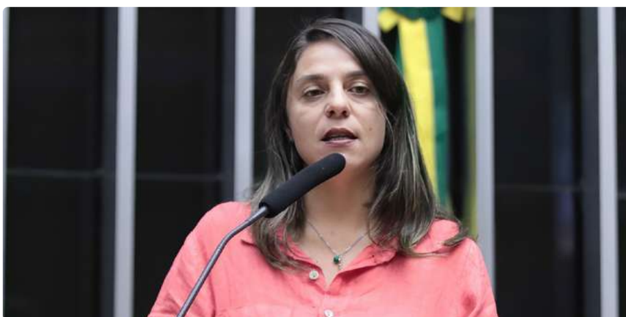
Deputada Federal Fernanda Melchionna

Acredito que as bibliotecas, em suas diversas formas - sejam elas públicas, comunitárias, especializadas ou universitárias - desempenham um papel crucial na promoção da leitura e na formação cidadã. No caso da biblioteca escolar, é vital que estas sejam ativas e integradas ao processo pedagógico, funcionando como centros vivos e participativos dentro das escolas. Elas devem estar conectadas com os currículos escolares e ser parte fundamental das estratégias de ensino e aprendizagem. É importante pensarmos as bibliotecas como espaços