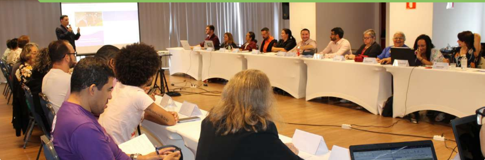
Abertura do Evento