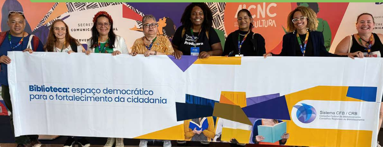
Bibliotecários com banner do evento.

em profundidade temas relacionados à formação do Setorial do Livro, Leitura, Literatura e Bibliotecas. Essas atividades permitiram uma troca rica de ideias e experiências, reforçando a necessidade de ações concretas para fortalecer as bibliotecas e garantir que elas continuem a desempenhar um papel central na promoção da cultura e da educação no Brasil.