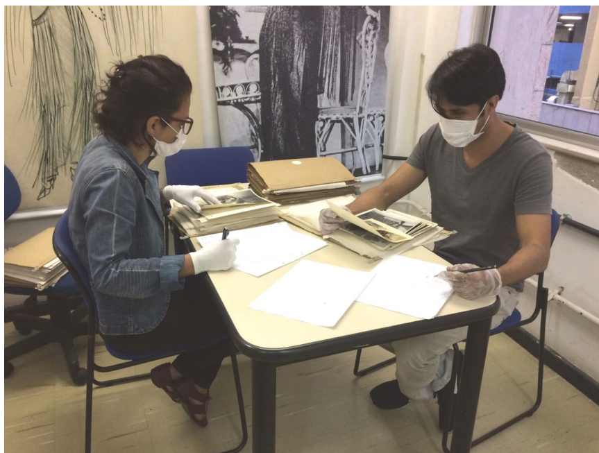
Equipe da Data Coop trabalha na identificação de documentos para o Projeto Memória das Artes, da Funarte

“Na área de conservação estamos habilitados para trabalhar até mesmo com obras raras e nos deparamos com concorrentes que fazem limpeza da Baía da Guanabara ou dedetização. Quem prepara a licitação nem sempre sabe a diferença entre higienização comum e especializada”, explica. Para corrigir isto, a Data Coop atua politicamente junto a entidades da categoria e ao judiciário, explicando as especificidades que só podem ser atendidas por profissionais devidamente capacitados. 📖